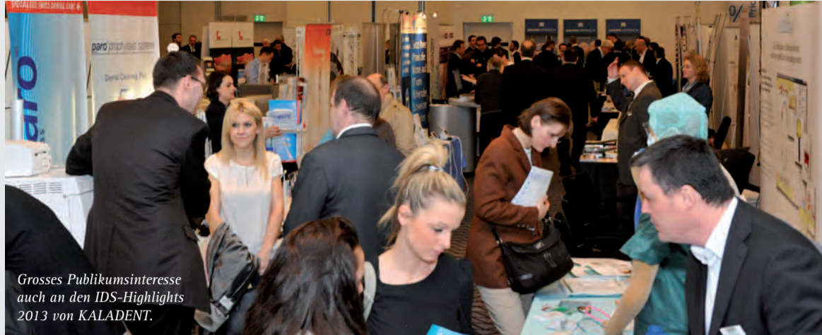
Grosses Publikumsinteresse auch an den IDS-Highlights 2013 von KALADENT.

Mehr Bilder von den KALADENT „IDS-Highlights“